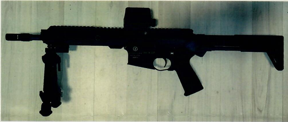
Abbildung 1: Schmeisser, „AR15 S4F Sport“, mit einer Lauflänge von 27 cm, den o. g. Änderungsmerkmalen und Standardkompensator