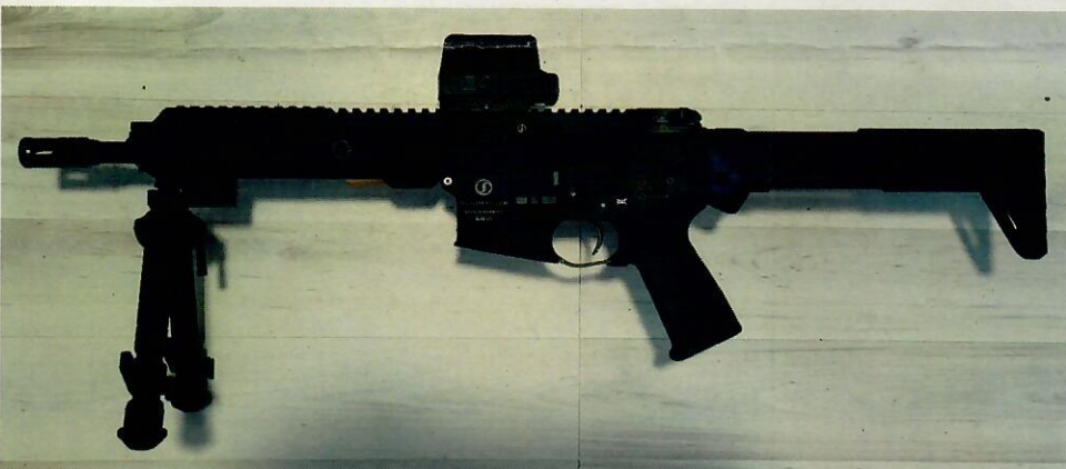
Abbildung 3: Schmeisser, „AR15 S4F Sport“, mit einer Lauflänge von 27 cm, den o. g. Änderungsmerkmalen und Standardmündungsbremse