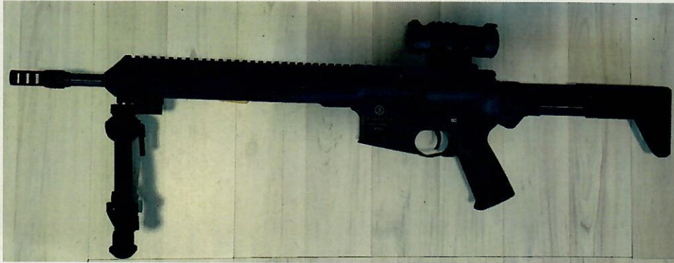
Abbildung 4: Schmeisser, „AR15 S4F Sport“ mit M4F Sport Wechselsystem, einer Lauflänge von 37 cm und den o. g. Änderungsmerkmalen (in Kombination mit den Mündungsaufsätzen gem. Abbildung 1 bis 3)