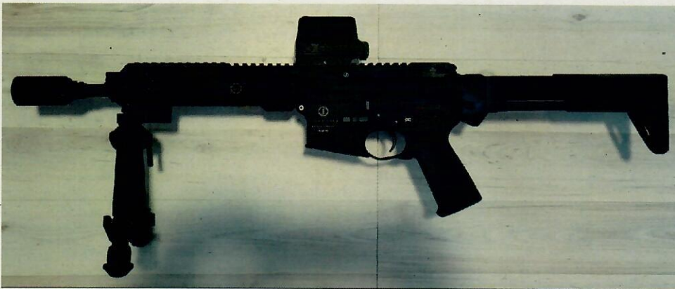
Abbildung 2: Schmeisser, „AR15 S4F Sport“, mit einer Lauflänge von 27 cm, den o. g. Änderungsmerkmalen und Linearkompensator („Blastdeflektor“)