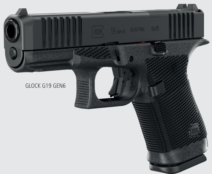
GLOCK G19 GEN6

Der hohe Undercut am Abzugsbügel sorgt für einen besseren Halt und mehr Komfort.