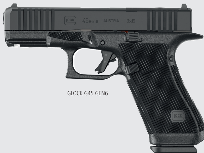
GLOCK G45 GEN6

Die Handflächenwölbung passt die Pistole an die natürliche Krümmung der Hand an.